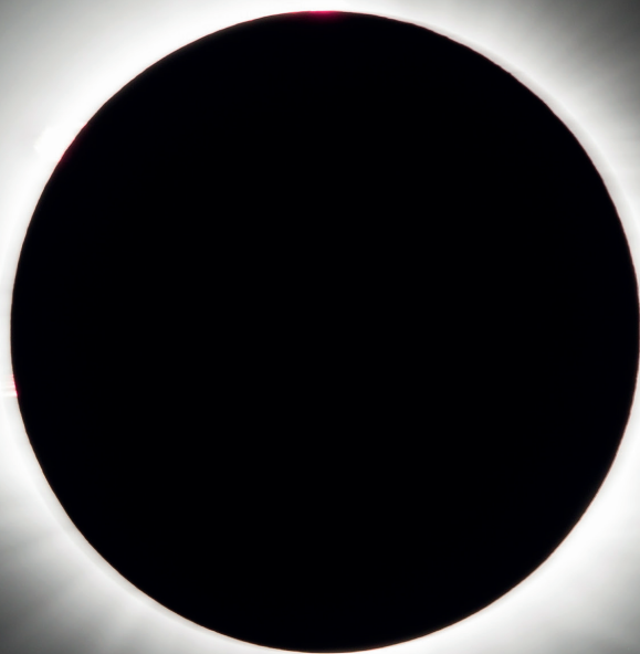
El lunes 21 de agosto de 2017 se observó un eclipse solar total sobre Madras, Oregón.