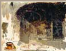
Joaquín Sorolla Bastida