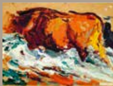
Joaquín Sorolla Bastida