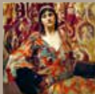
Joaquín Sorolla Bastida