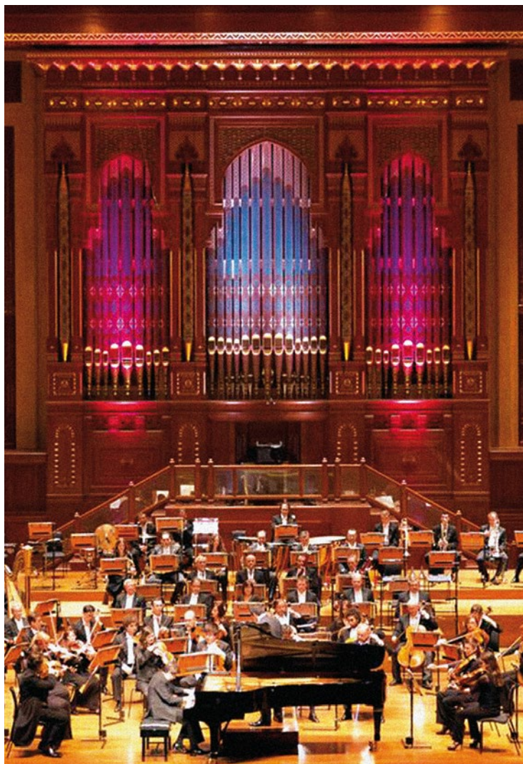
📷 Fotografías del concierto de la Orquesta Nacional de España en la Royal Opera House de Muscat el 12 de noviembre de 2013