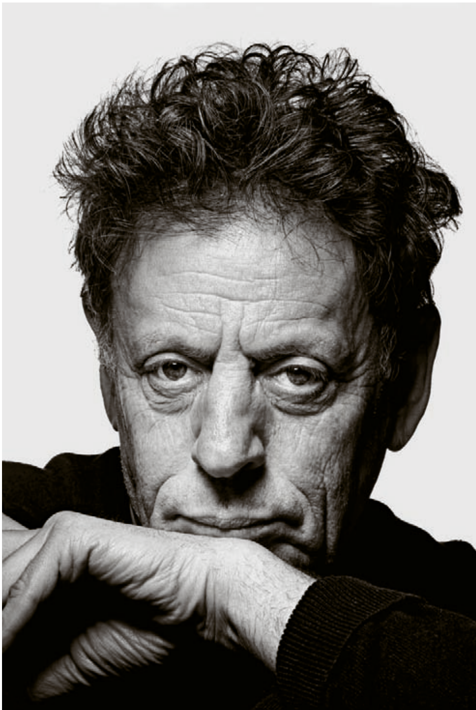
● Philip Glass

el pop, el rock y etiquetas pasajeras como la «new age». Miembro de un club selecto al que pertenecen también Arvo Pärt o John Adams (sospechosos de un delito tan detestable entre los compositores vivos como es el aprecio del público o, sin más, de cultivar la belleza desde presupuestos fácilmente reconocibles para cualquier sensibilidad) Philip Glass sigue a día de hoy creando a un ritmo envidiable, y a buen seguro que su repertorio ofrecerá todavía unas cuantas obras perdurables más.