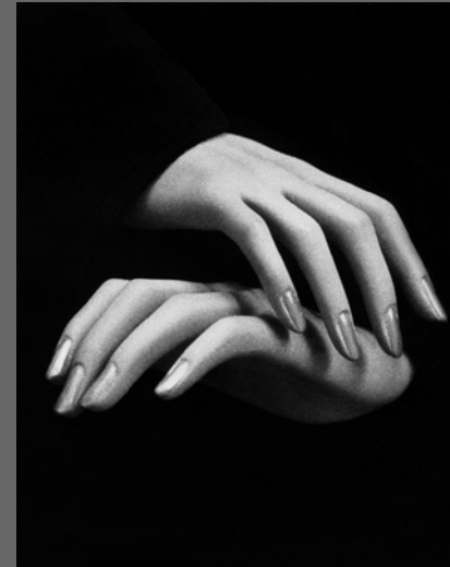
IMAGEN DE CUBIERTA