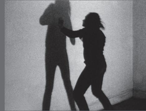
IMAGEN DE CUBIERTA